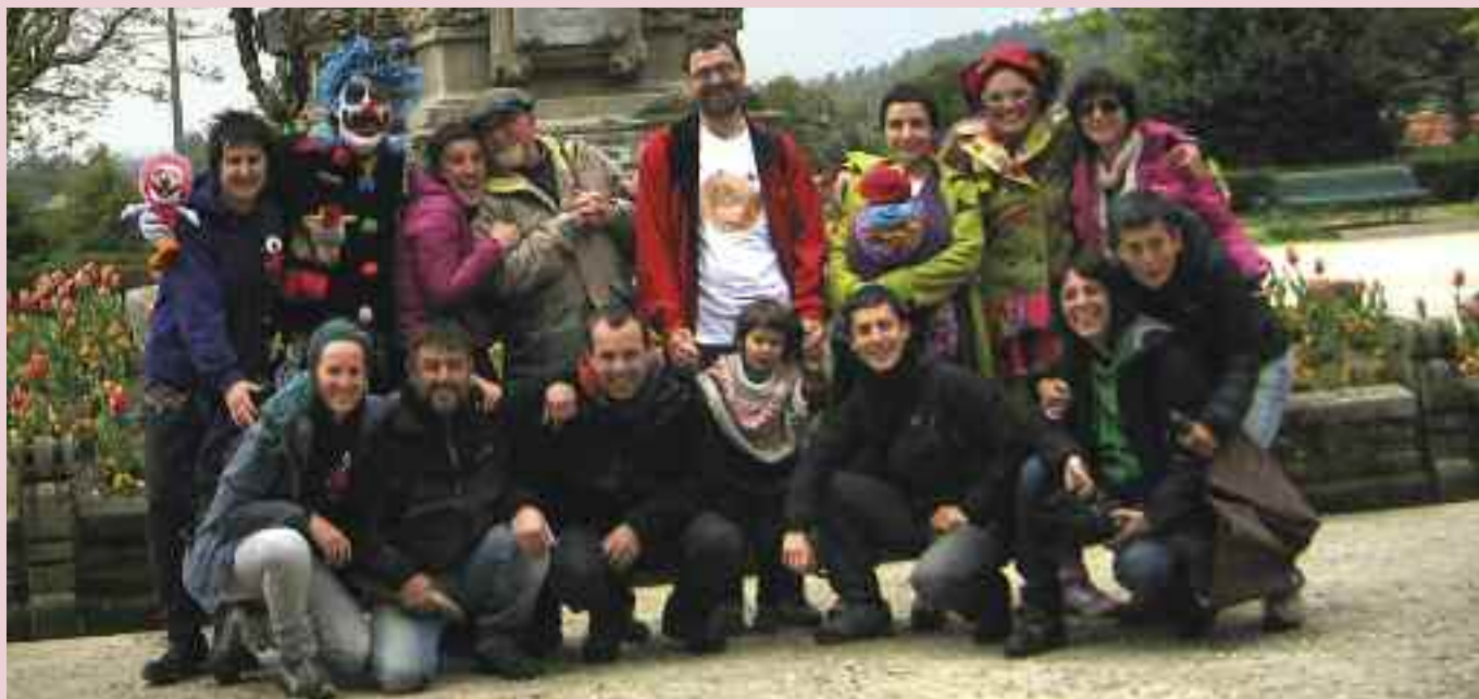
Euskal Herritik joandako taldekideak Galizako Semente eskolako hainbat kiderekin

Komunitateari irekitako eskola da Semente. Auzoaz eta Compostelaz arduratzen den eskola da. Saiatzen gara herriaren errealitateari eta egunerokoari kasu egiten eskolan bertan.